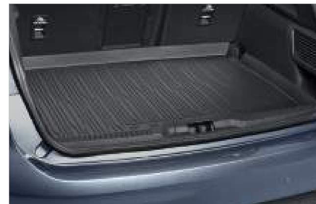
MATA ANTYPOŚLIZGOWA DO BAGAŻNIKA

1 439 zł - wszystkie wersje wyposażone w bagażnik dachowy