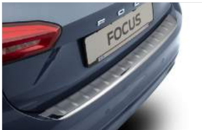
OCHRONA TYLNEGO ZDERZAKA - POLEROWANA STAL NIERDZEWNA (2 310 632)

385 zł - wersja 5-drzwiowa 390 zł - wersja kombi