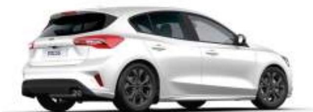
FROZEN WHITE - LAKIER ZWYKŁY

bez dopłaty Lakier niedostępny dla wersji ST X Edition