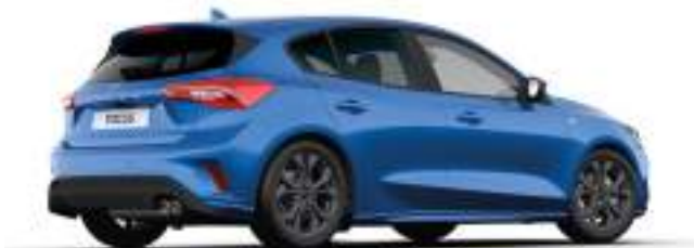
DESERT ISLAND BLUE - LAKIER METALIZOWANY

2 300 zł Lakier niedostępny dla wersji ST X i ST X Edition