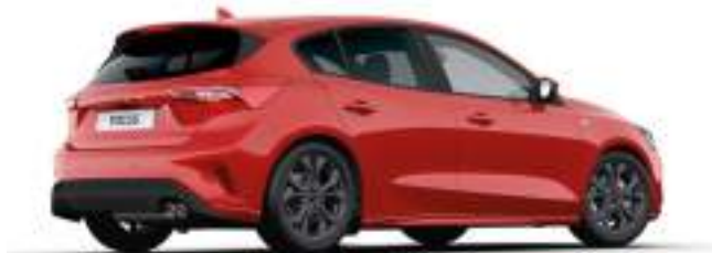
RACE RED - LAKIER ZWYKŁY

bez dopłaty Lakier niedostępny dla wersji ST X Edition