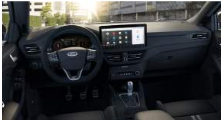
Ford Focus® w wersji St X Edition ze skrzynią manualną i z fotelami kubetkowymi Ford Performance (AGR) z niebieskimi akcentami (standard)