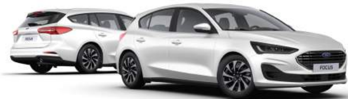
Ford Focus® w wersji Titanium (5d - po prawej, kombi - po lewej stronie) Kolor nadwozia Frozen White (opcja)