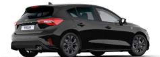
AGATE BLACK - LAKIER METALIZOWANY SPECJALNY

5 100 zł Lakier niedostępny dla wersji ST X Edition