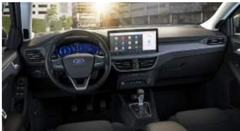
Ford Focus® w wersji Active X ze skrzynią manualną i tapicerką materiałową (standard)