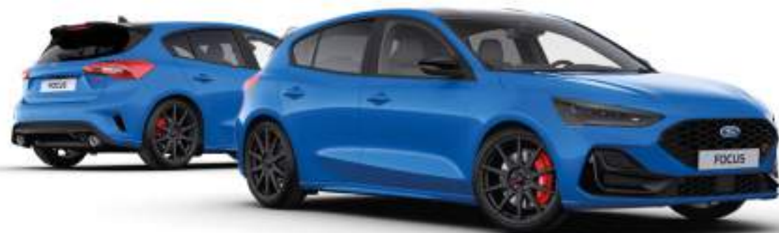
Ford Focus® w wersji St X Edition Kolor nadwozia Azura Blue (bez dopłaty)