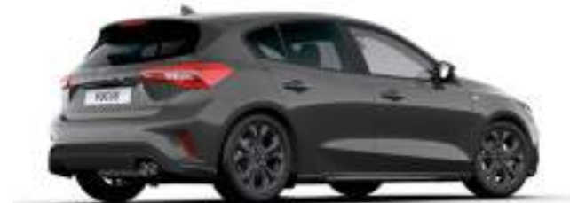
MAGNETIC GREY - LAKIER METALIZOWANY

2 300 zł Lakier niedostępny dla wersji ST X i ST X Edition