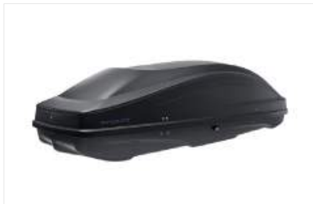
G3* BOX DACHOWY ELEGANCE EUROPE 370, CZARNY MATOWY (2 191 628)

1 464 zł - dla wersji kombi wyposażonej w relingi