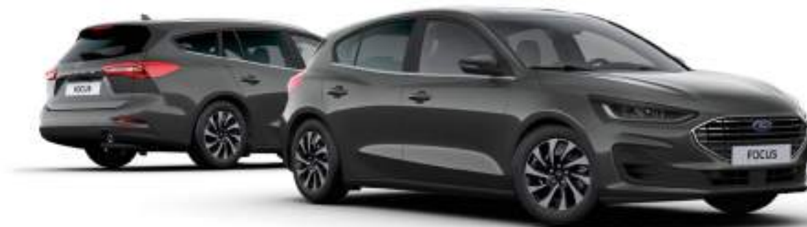
Ford Focus® w wersji Titanium X (5d - po prawej, kombi - po lewej stronie) Kolor nadwozia Magnetic Grey (opcja)