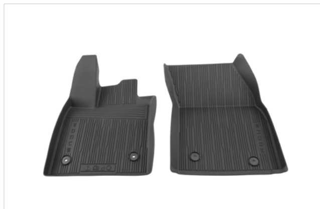
DYWANIKI PODŁOGOWE, GUMOWE CZARNE - NA PRZÓD (2 531 196)