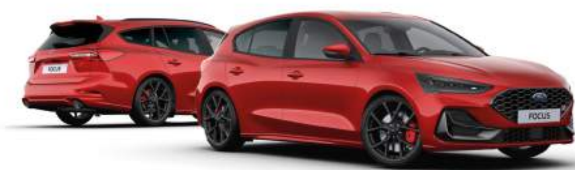
Ford Focus® w wersji ST X (5d - po prawej, kombi - po lewej stronie) Kolor nadwozia Fantastic Red (opcja)