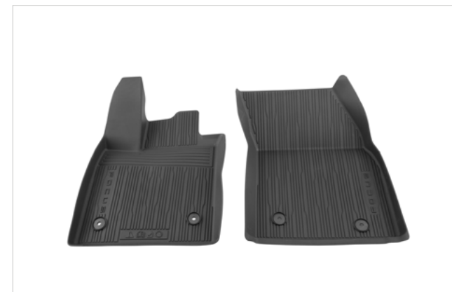
DYWANIKI PODŁOGOWE, GUMOWE CZARNE - NA PRZÓD (2 531 196)