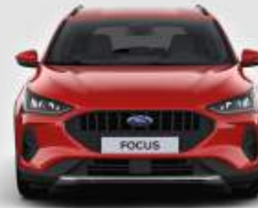
Szerokość całkowita z lusterkami bocznymi: 1979 mm