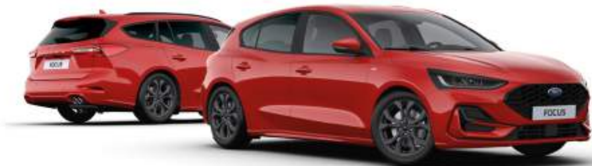
Ford Focus® w wersji ST-Line X (5d - po prawej, kombi - po lewej stronie) Kolor nadwozia Race Red (bez dopłaty)