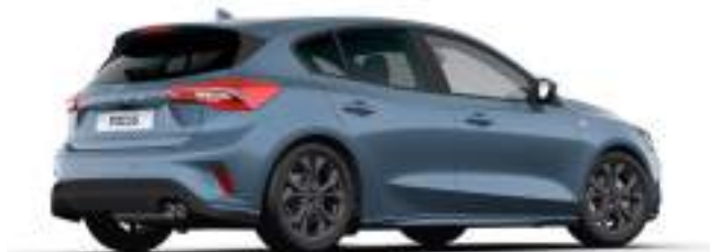
CHROME BLUE - LAKIER METALIZOWANY

2 300 zł Lakier niedostępny dla wersji ST X i ST X Edition