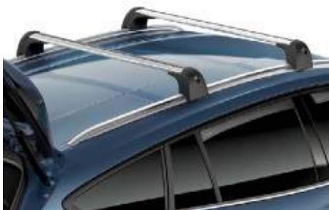
BAGAŻNIK DACHOWY (2 203 142)

1 464 zł - dla wersji kombi wyposażonej w relingi