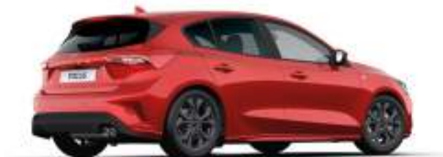
FANTASTIC RED - LAKIER METALIZOWANY SPECJALNY

2 800 zł Lakier niedostępny dla wersji ST X i ST X Edition