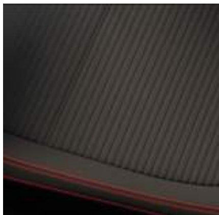
Ford Focus® w wersji ST-Line X ze skrzynią manualną i tapicerką materiałową z czerwonymi akcentami (standard)