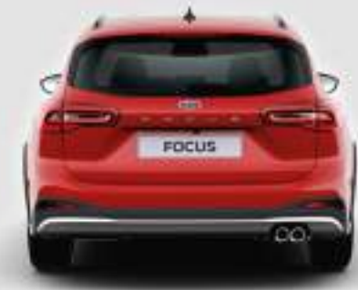
Szerokość całkowita ze złożonymi lusterkami: 1848 mm