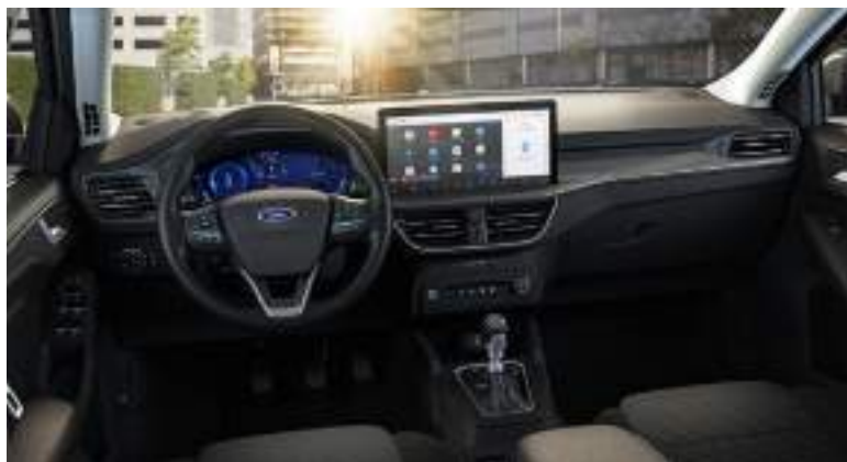
Ford Focus® w wersji Titanium X ze skrzynią manualną i tapicerką materiałową (standard)