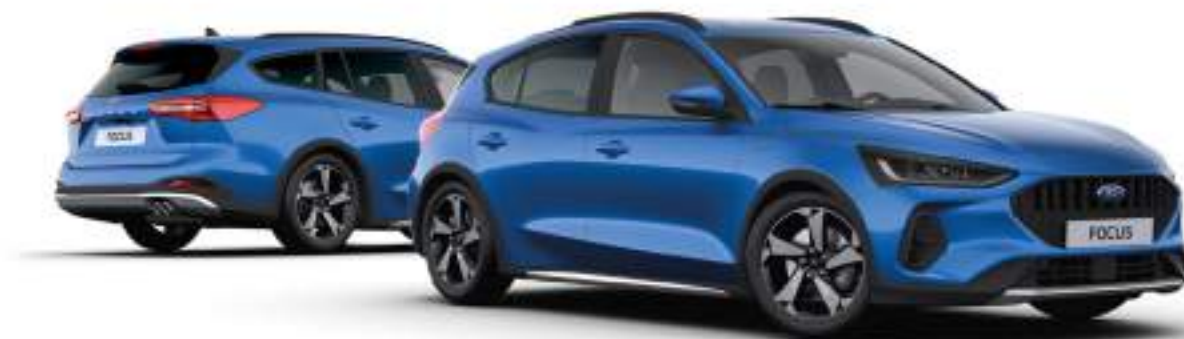
Ford Focus® w wersji Active X (5d - po prawej, kombi - po lewej stronie) Kolor nadwozia Desert Island Blue (opcja)