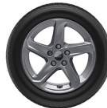
16" KOMPLET KÓŁ ZIMOWYCH Z CZUJNIKAMI CIŚNIENIA OGUMIENIE DUNLOP WINTER SPORT 5, 205/60 R16 92 H (2 773 511)