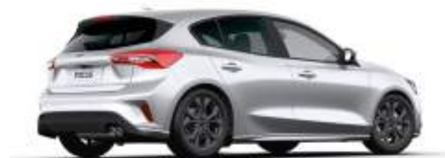
MOONDUST SILVER - LAKIER METALIZOWANY

750 zł Lakier niedostępny dla wersji ST X Edition