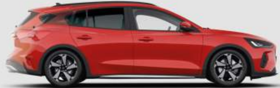
Długość całkowita 5 drzwiowa: Titanium / Titanium X, ST-Line X: 4382 mm, Active X: 4397 mm, ST X / ST X Edition: 4393 mm Kombi: Titanium / Titanium X, ST-Line X: 4672 mm, Active X: 4693 mm, ST X / ST X Edition: 4675 mm